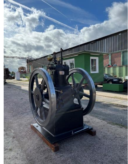
GNOM mit unserem Vereinshäuschen